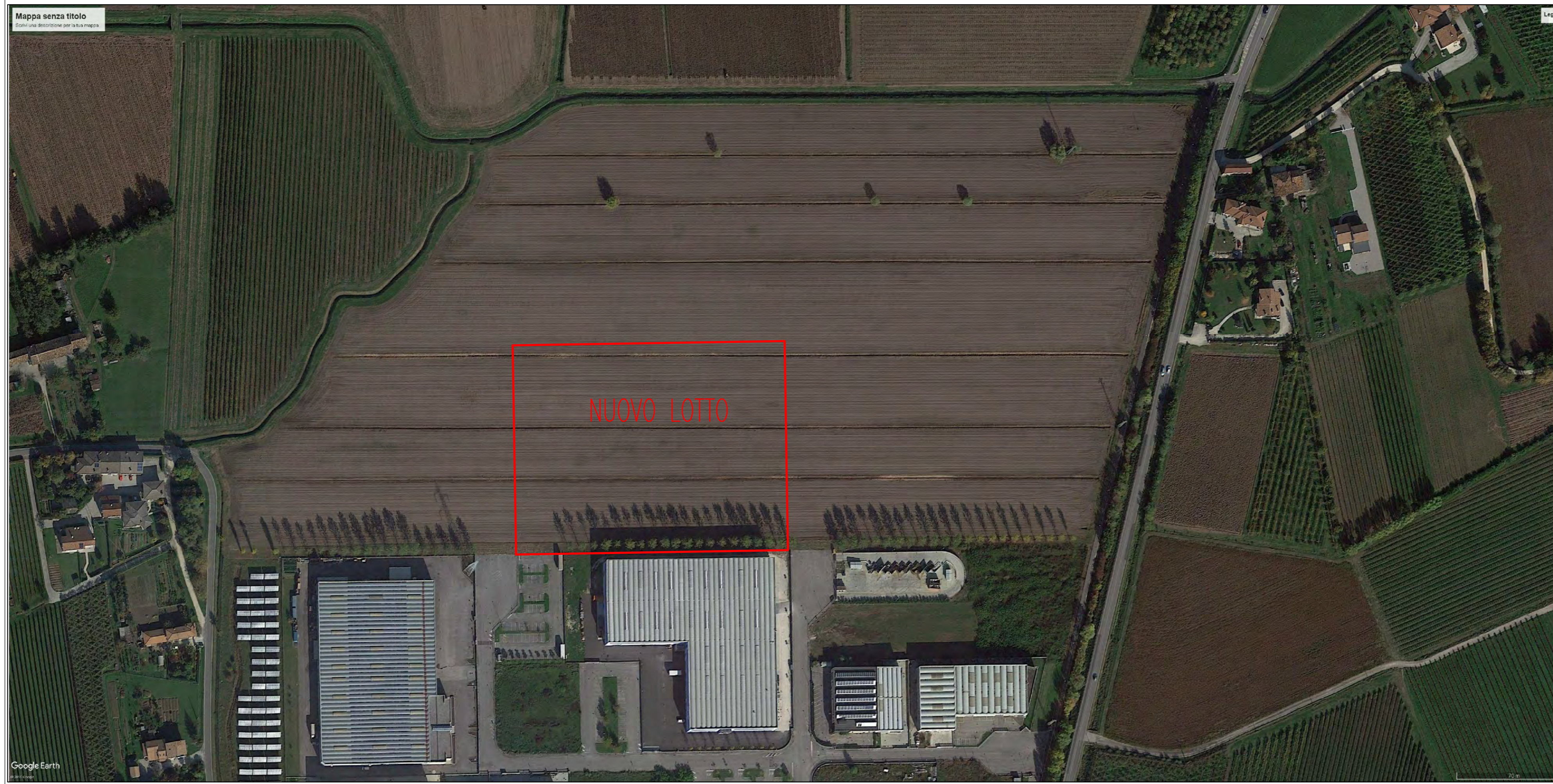
FOTO AEREA DA GOOGLE EARTH

SEZ. FOGL. MAPPA: A01 SCALA: 1 : 500 DATA: 13/06/2017