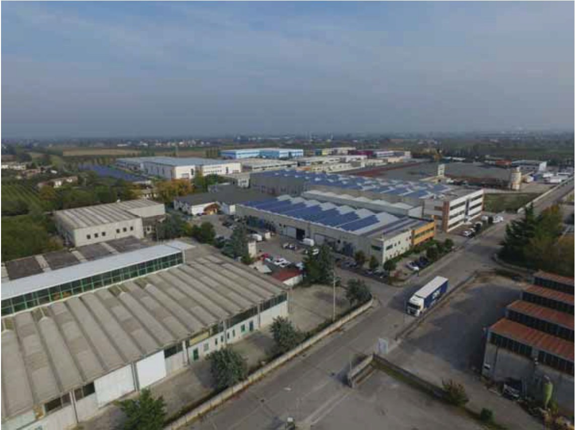
Posizione aerea “15” (obiettivo rivolto ad est) – via Toniolo