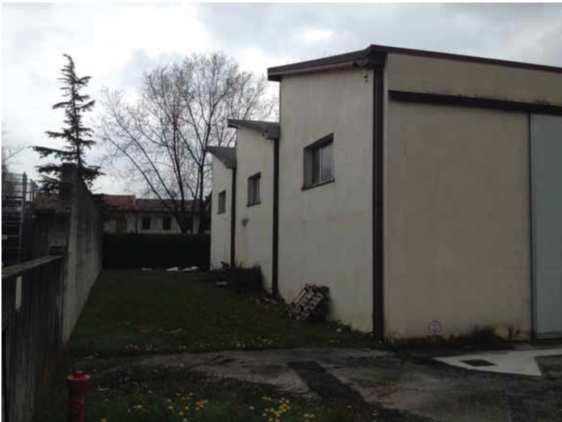
Posizione a terra “6” (obiettivo rivolto ad nord) – via Toniolo – corpo di fabbrica 4