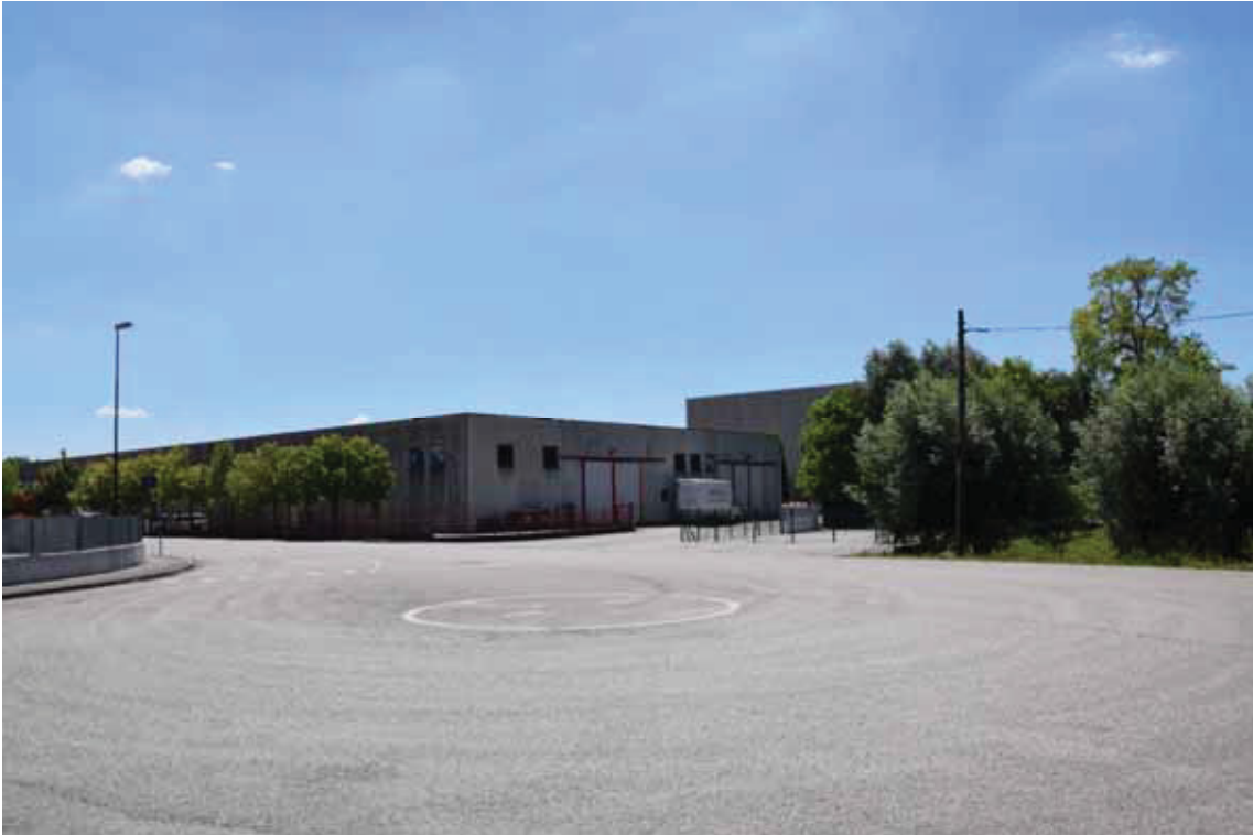
Posizione a terra “13” (obiettivo rivolto a sudest) – via Moretto