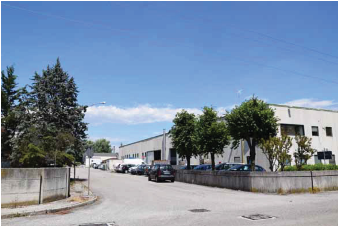
Posizione a terra “4” (obiettivo rivolto ad est) – via Toniolo – corpo di fabbrica 1