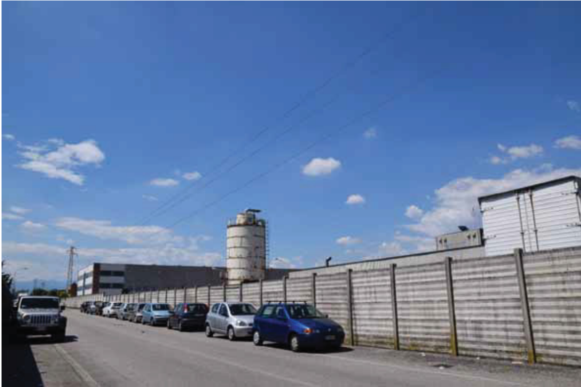
Posizione a terra “1” (obiettivo rivolto a nord) – via Toniolo