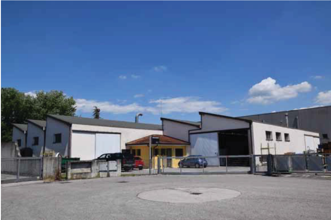
Posizione a terra “5” (obiettivo rivolto ad est) – via Toniolo – corpo di fabbrica 4