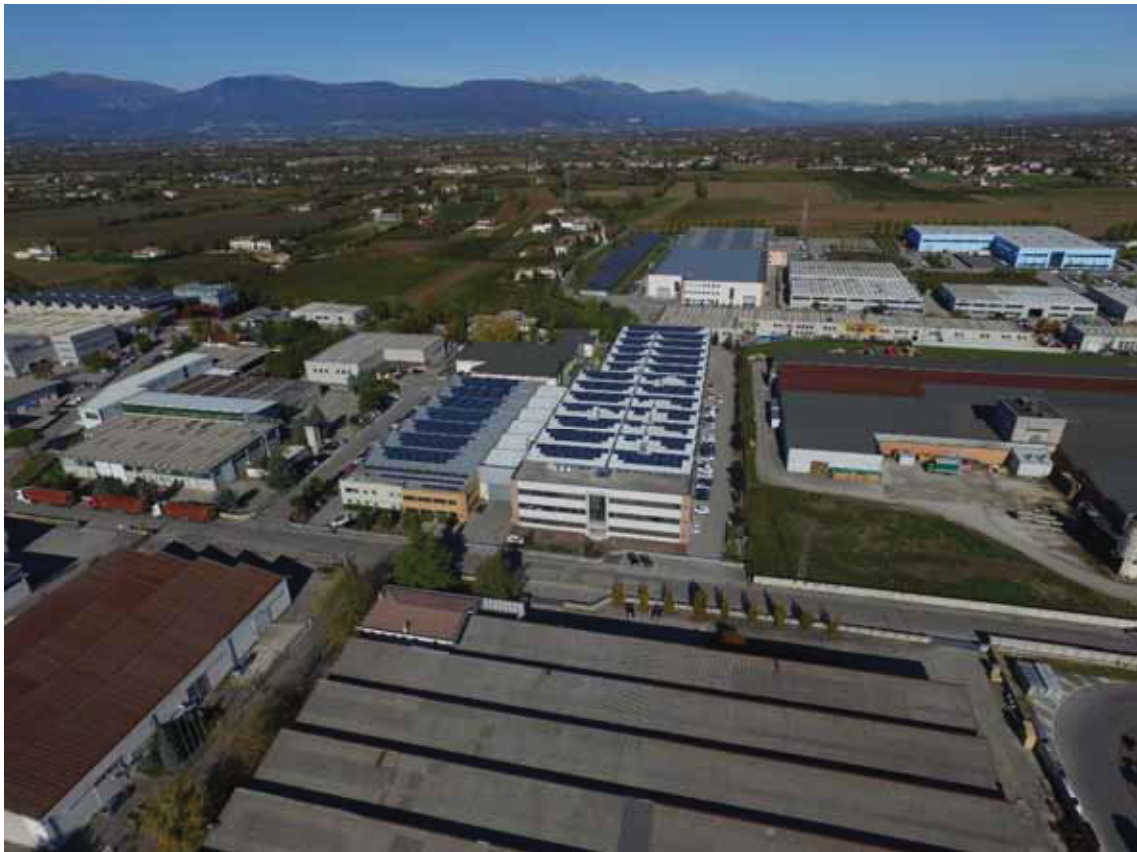
Posizione aerea “14” (obiettivo rivolto a nord) – via Toniolo