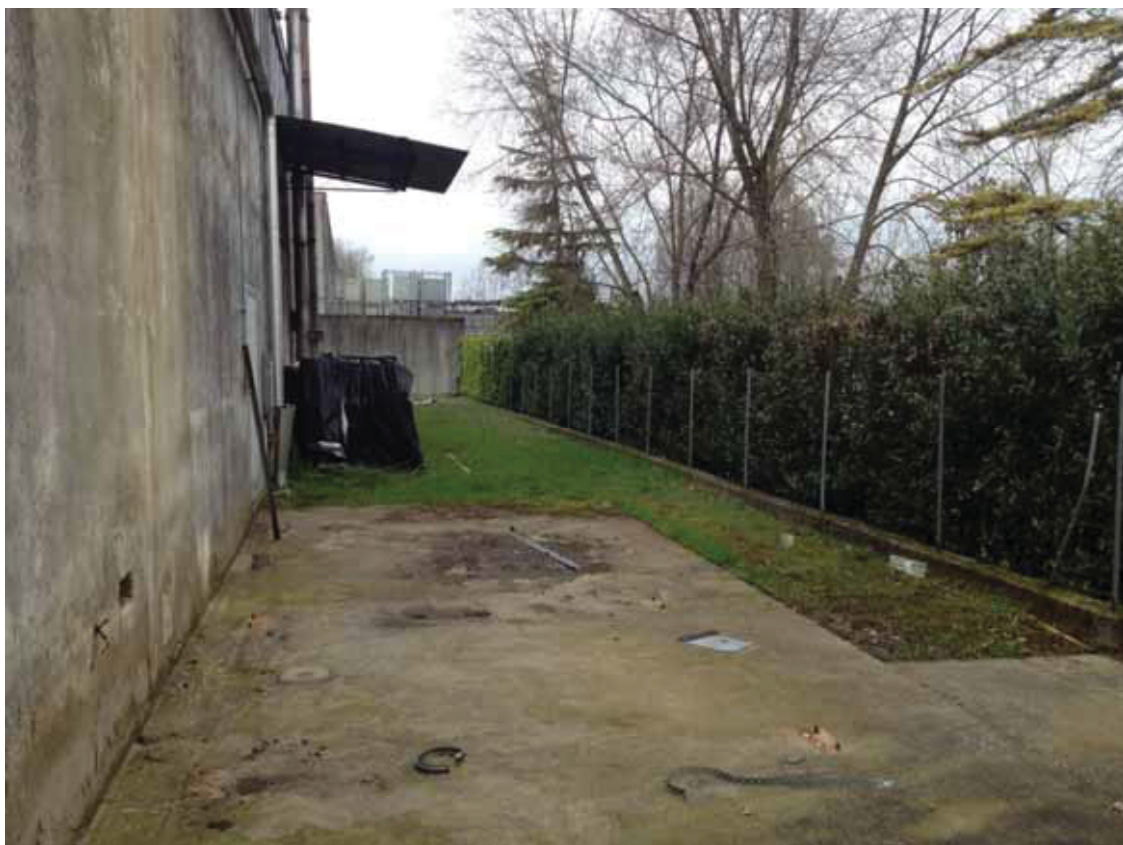
Posizione a terra “7” (obiettivo rivolto ad ovest) – corpo di fabbrica 4