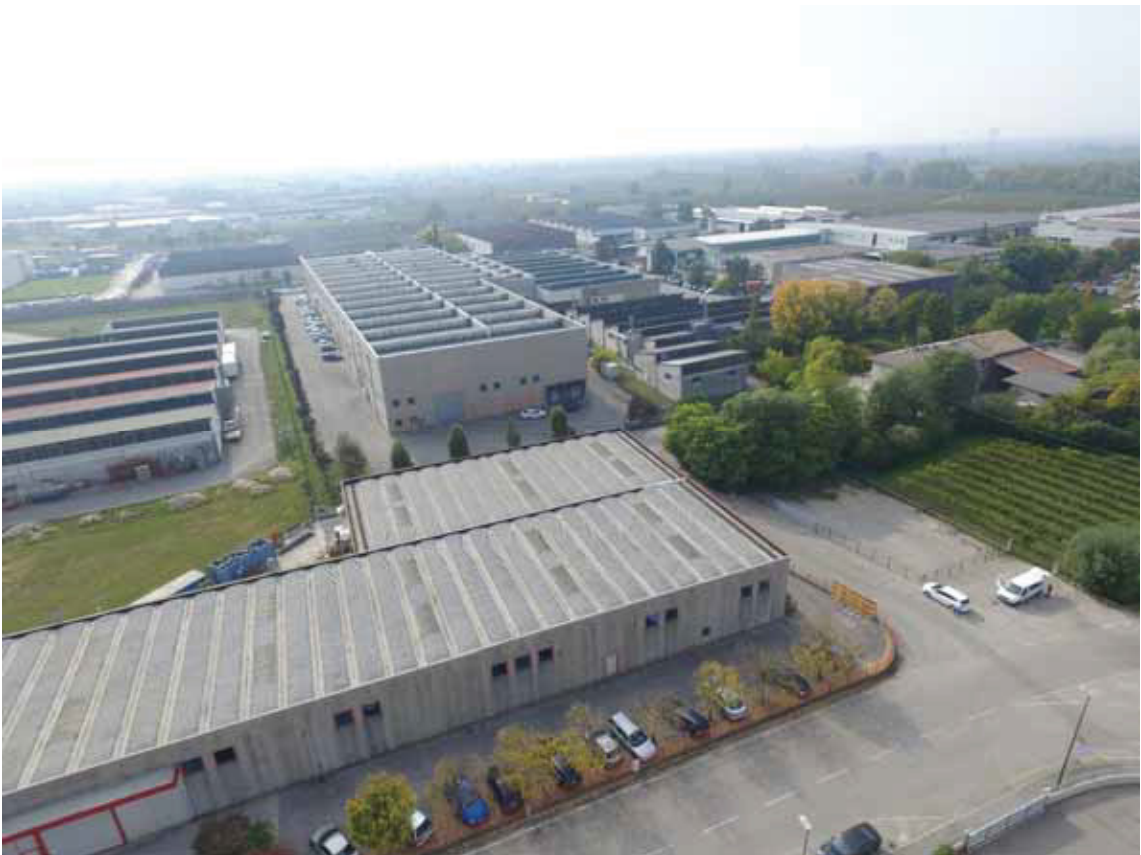
Posizione aerea “16” (obiettivo rivolto a sudovest) – via Moretto