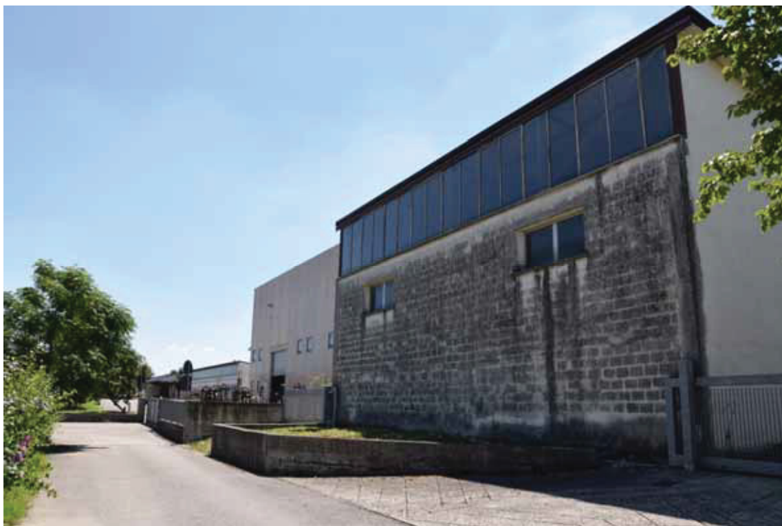
Posizione a terra “9” (obiettivo rivolto ad est) – servitù di passaggio per via Moretto – corpo di fabbrica 4