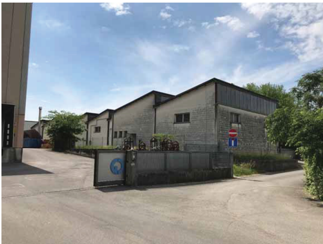
Posizione a terra “10” (obiettivo rivolto ad ovest) – servitù di passaggio per via Moretto – corpo di fabbrica 4