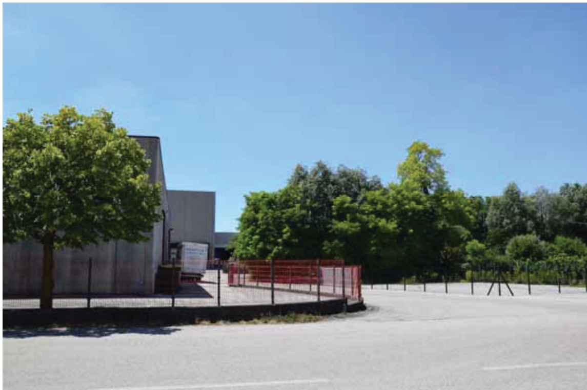
Posizione a terra “12” (obiettivo rivolto a sud) – servitù di passaggio da via Moretto