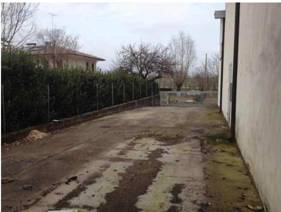
Posizione a terra “8” (obiettivo rivolto ad nord) – uscita su servitù – corpo di fabbrica 4