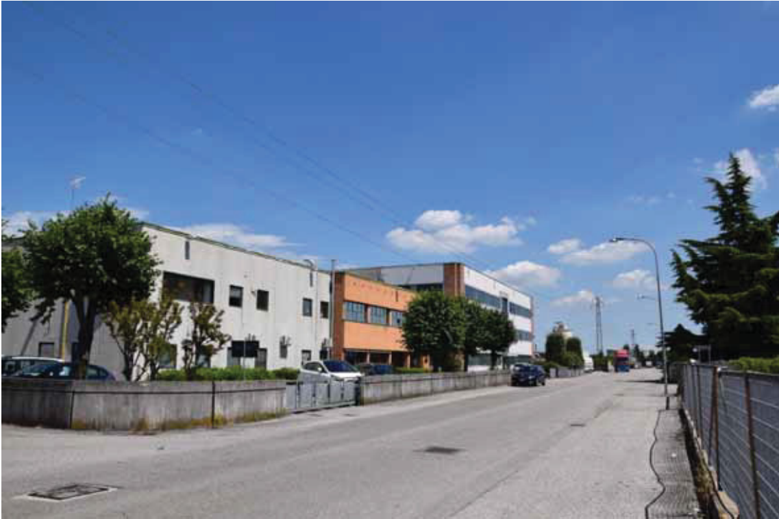
Posizione a terra “3” (obiettivo rivolto a est) – via Toniolo – corpo di fabbrica 1