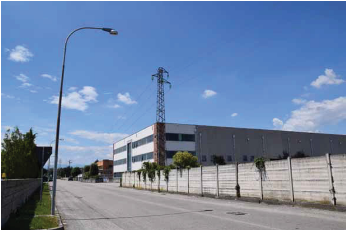
Posizione a terra “2” (obiettivo rivolto a nord) – via Toniolo – corpo di fabbrica 2