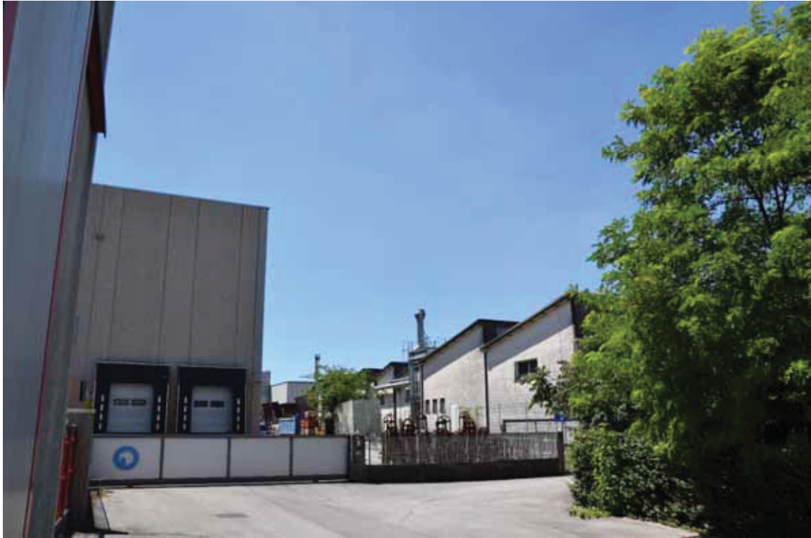
Posizione a terra “11” (obiettivo rivolto a sud) – servitù di passaggio per via Moretto – fabbricati 2 e 4