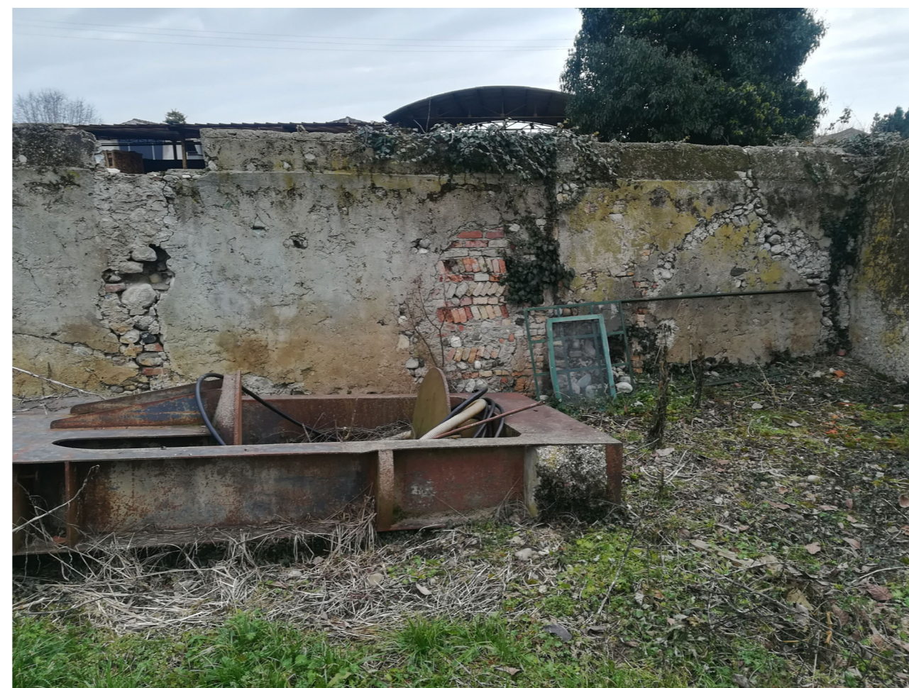
FOTO MURO DA SBRECCIARE