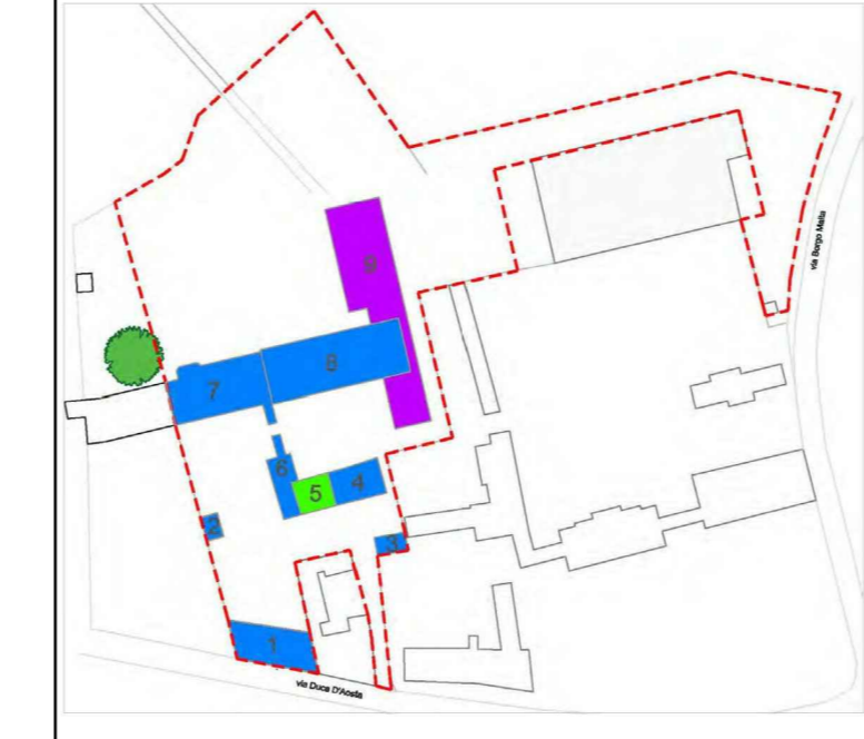
TABELLA SUPERFICI COPERTE STATO DI FATTO/PROGETTO