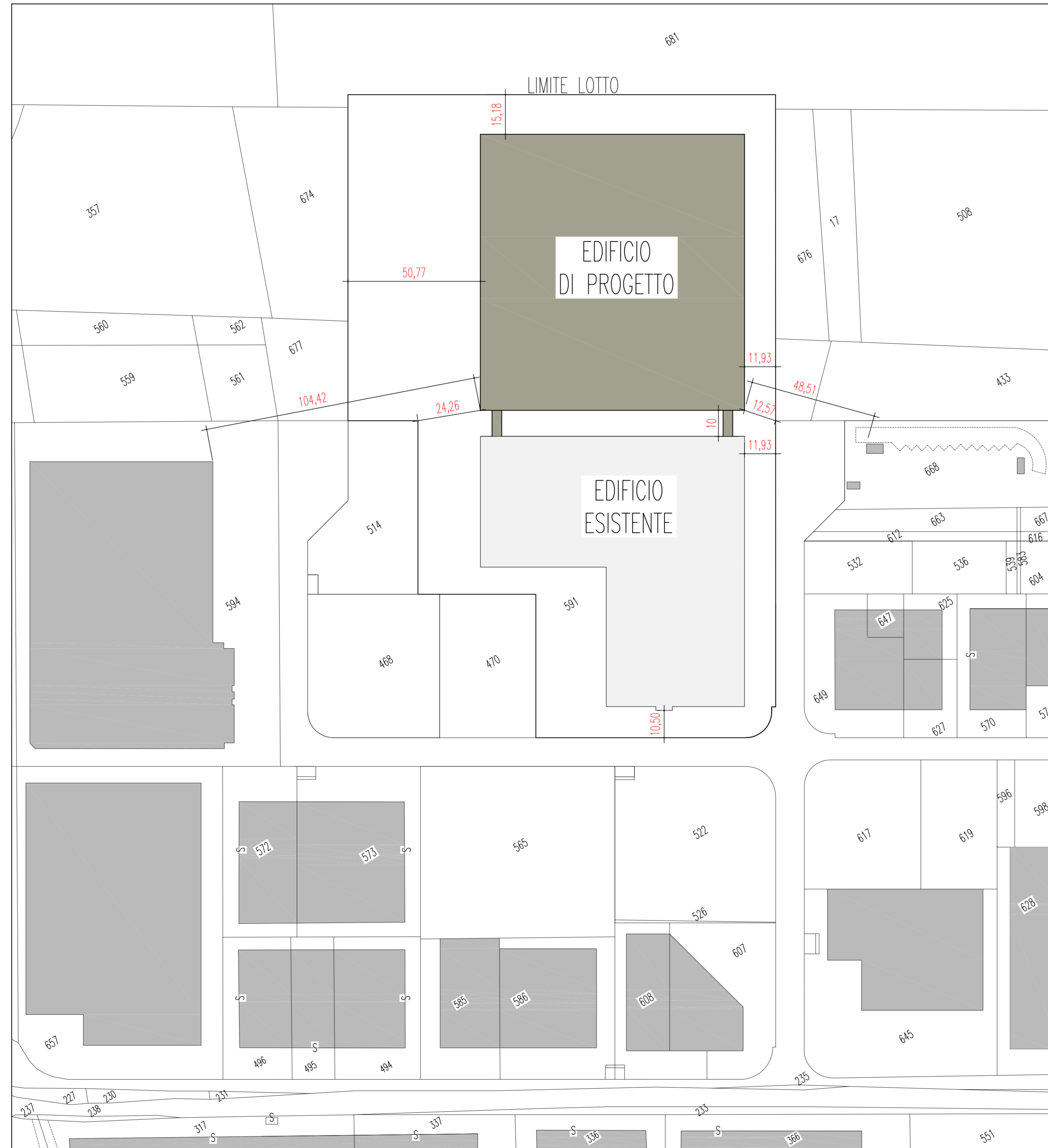
PLANIMETRIA SCALA 1 : 1000

SEZ. FOG. MAPP. A/1 M.N. 591-675-682-679-431-678 SCALA: 1 : 1.000 - 1 : 500 DATA: 13/06/2017 Elaborato n° A05