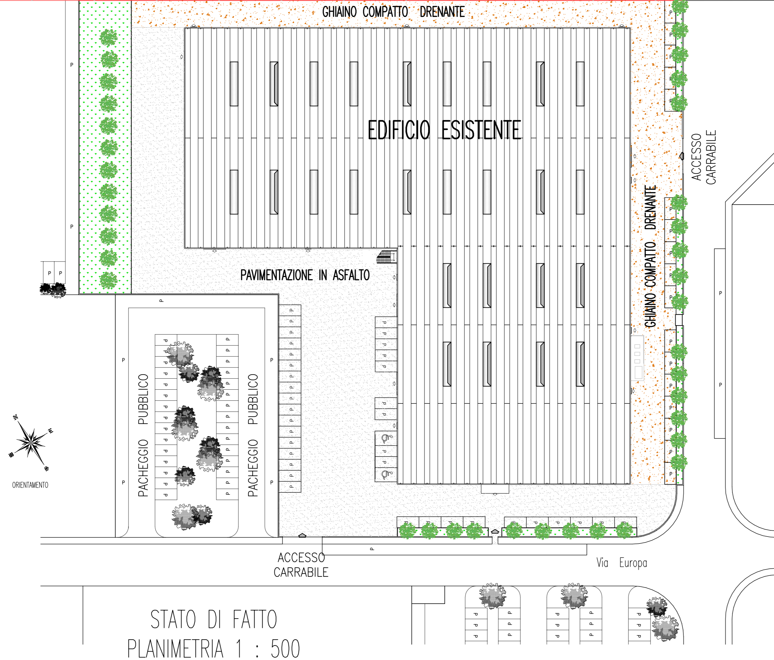
STATO DI FATTO PLANIMETRIA 1 : 500